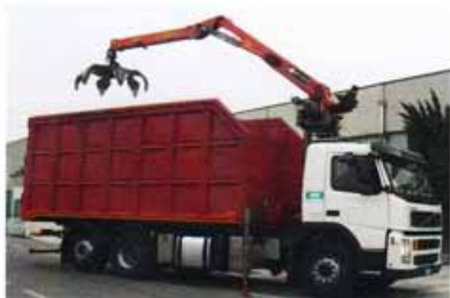
RACCOLTA RIFIUTI CON AUTOMEZZO MUNITO DI GRU MECCANICA