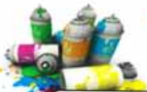
BOMBOLETTE SPRAY VUOTE