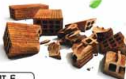
MATTONI E FORATI