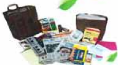
CARTA E CARTONE