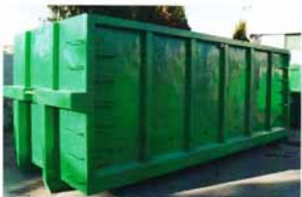
NOLEGGIO CONTAINER E PRESS-CONTAINER