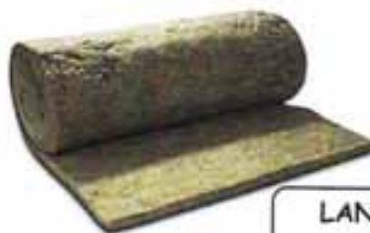
LANA DI VETRO