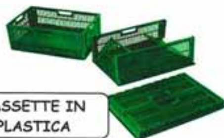
CASSETTE IN PLASTICA