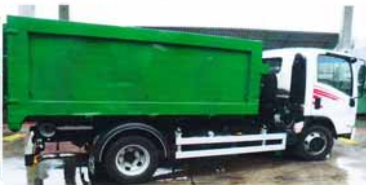
TRASPORTO CONTAINER 8-10 MC