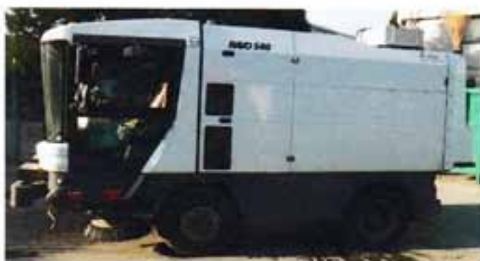
SPAZZAMENTO STRADE E PIAZZALI