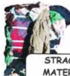
STRACCI E MATERIALI FILTRANTI