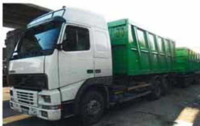
TRASPORTO CON MOTRICE - AUTOTRENO